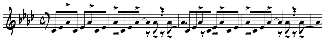
Figure 3 : Joe Garland et Andy Razaf, In the Mood , mes. 9-10, ♩ = 155 (« Swing. Not too fast! »), retranscription de partition d'Alan Glasscock. Le saxophone alto a les hampes vers le haut, la trompette vers le bas.

Piazzolla fait souvent usage d'une polyrythmie de trois croches dans une mesure à 4/4, élément distinctif du jazz et connu sous le nom de « secondary rag » (Sargeant 1959, p. 64). Brunelli (2011) avait déjà repéré cette caractéristique lorsqu'il se référait à l'utilisation d'un « concept de riff » du jazz de la part de Piazzolla, en proposant un rapprochement entre le morceau In the Mood interprété par l'orchestre de Glenn Miller et admiré par Piazzolla ( ibid. ), et Sens unique , de ce dernier, par le biais des groupements de trois en mesure binaire. Développons cette précieuse piste en observant les similitudes entre ce morceau de jazz et Muerte del ángel .