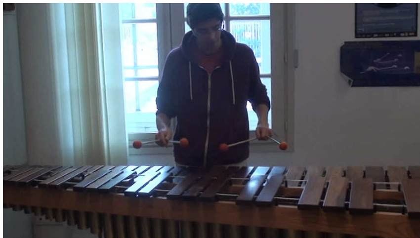
Extrait vidéo 3 : Travail du répertoire « Rotation 1, d'Eric Sammut ».

Cet exemple illustre l'utilisation du logiciel pour travailler une pièce solo du répertoire de percussions basée sur une analyse harmonique de l'œuvre. Ici, l'élève a analysé un passage de la pièce, puis a transcrit la grille d'accord dans le logiciel en vue de répéter ce même passage et d'inspirer son travail d'interprétation. Ce travail lui permet également d'analyser et de répéter son répertoire de manière plus créative.