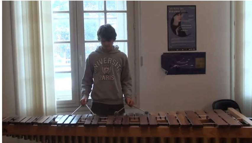
Extrait vidéo 2 : Exercices techniques à travers le « Canon de Pachelbel ».

Grâce au logiciel, les élèves peuvent découvrir et apprendre à jouer de nombreux styles de musique qui se divisent en trois grandes catégories : jazz, latin et pop. L'acquisition du logiciel donne également accès à des forums où l'on peut télécharger d'autres pièces s'inscrivant dans d'autres styles musicaux (classique, brésilien, fusion, rock, etc.) et pouvant être jouées dans un style jazz, latin ou pop.