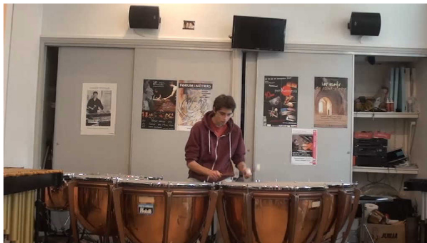
Extrait vidéo 6 : Blues en do aux timbales.

Le travail de la transposition est une habileté musicale parfois négligée auprès des musiciens classiques. Pourtant, le fait de transposer une phrase peut permettre de mieux se l'approprier et développe plus rapidement le jeu à l'oreille. Avec le logiciel, en un clic, il est possible de transposer une grille et de se servir d'un thème très simple pour les plus jeunes afin de l'obtenir dans toutes les tonalités.