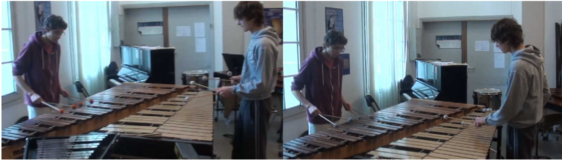
Extrait vidéo 9 : Jazz-Afro 12/8.